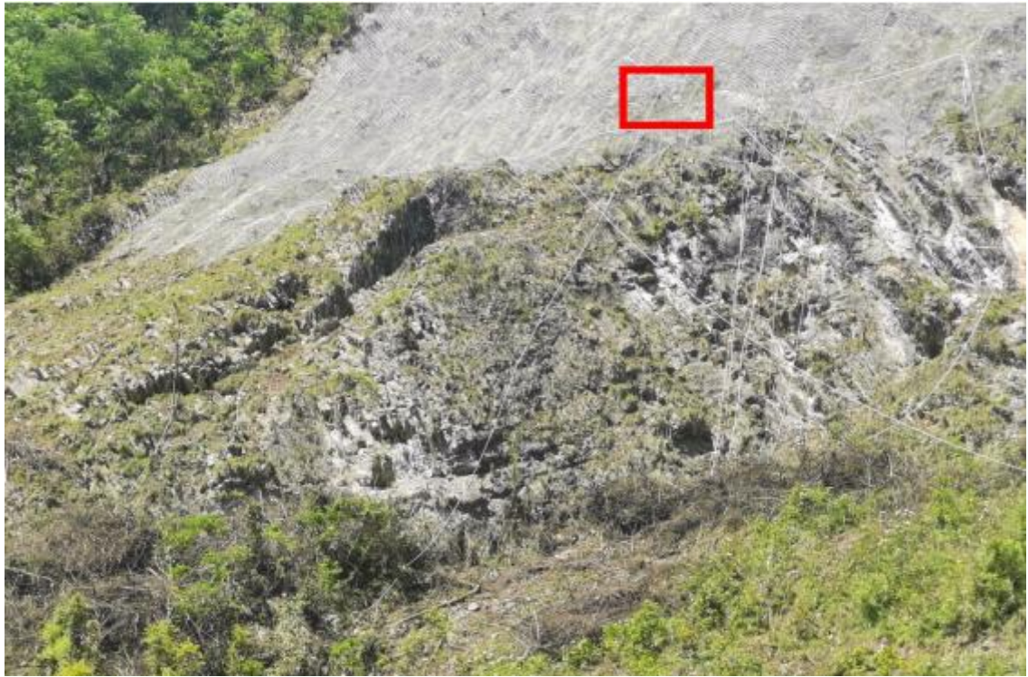
图二、红色方框处为事发前张**所在位置