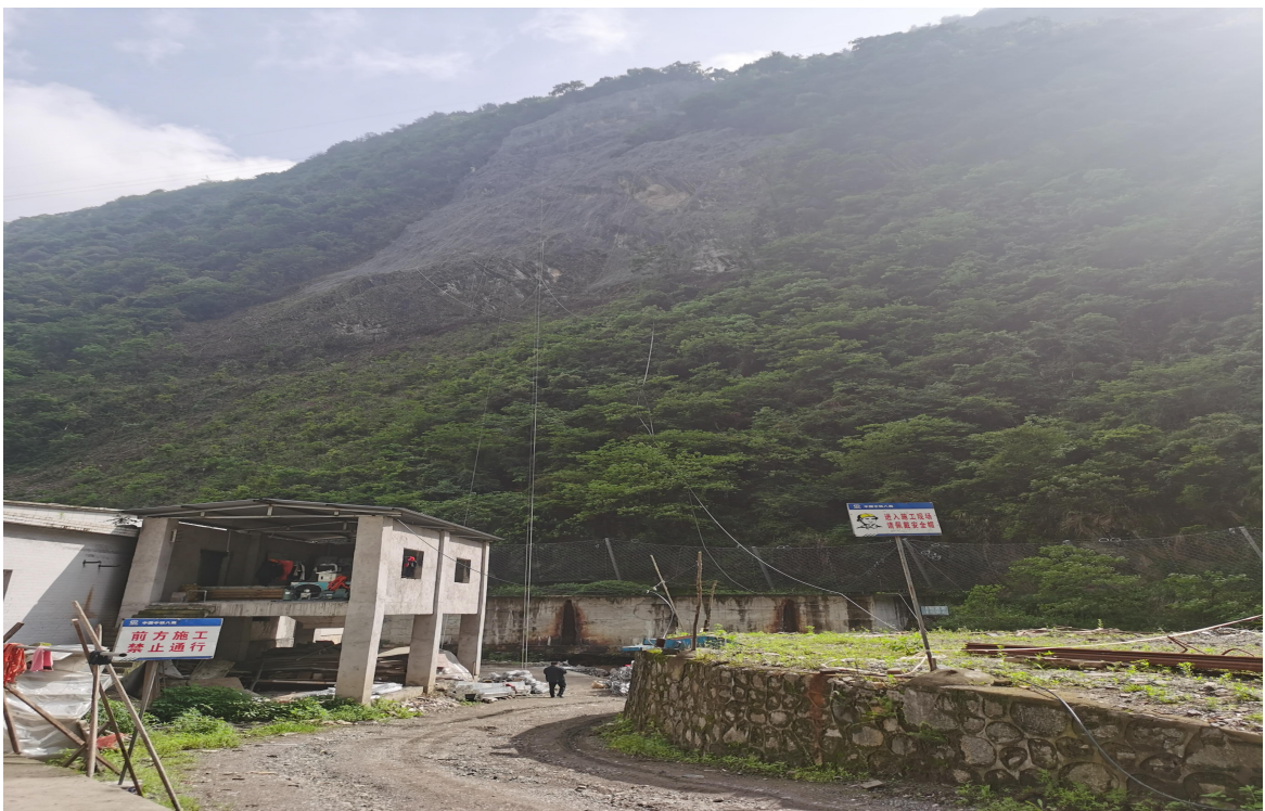
图一、金属防护网工程远景全貌图